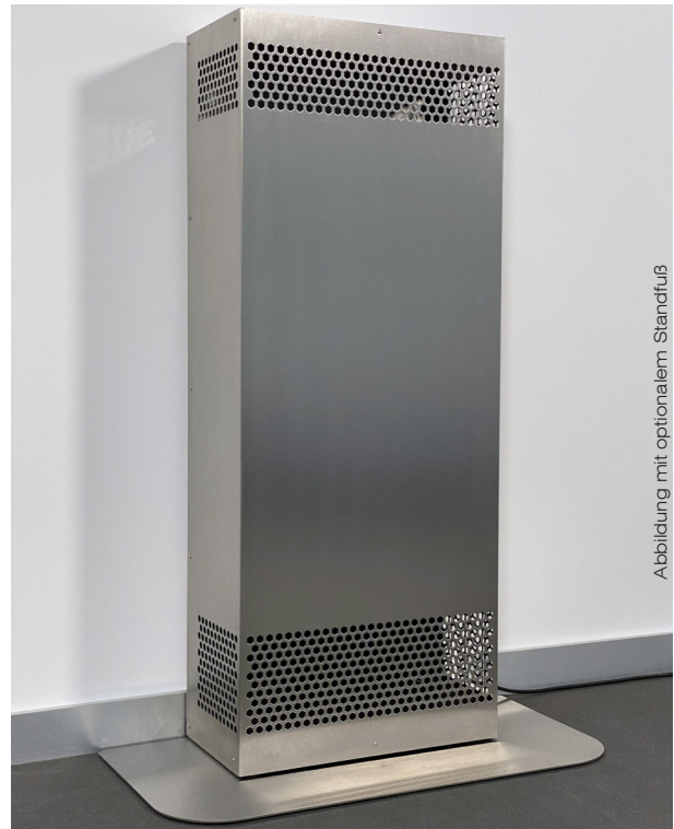
Abbildung mit optionalem Standfuß

Eine sichere Investition in die Zukunft – zum effizienten Schutz vor gesundheitsgefährdenden Aerosol-Infektionen.