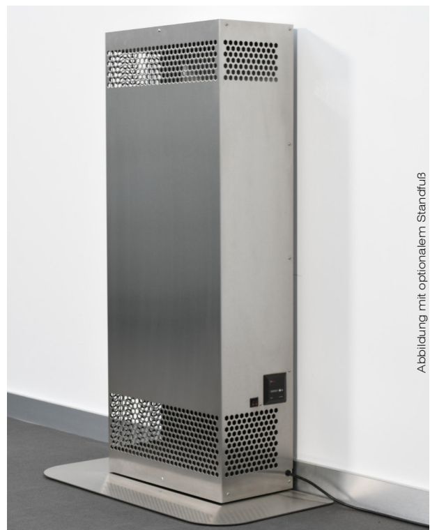
Abbildung mit optionalem Standfuß